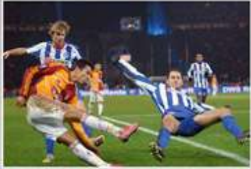
Hertha BSC - Galatasaray