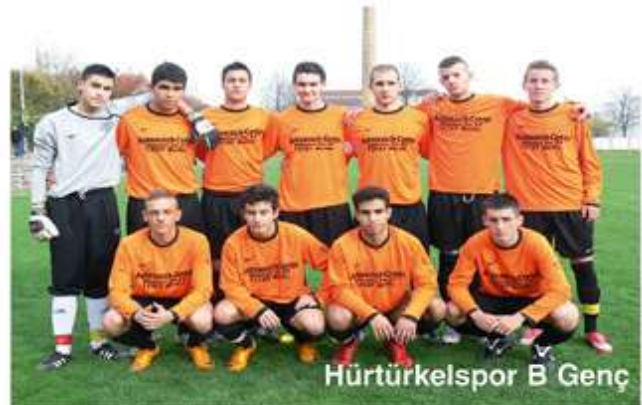
Hürtürkelspor B Genç

Geçtiğimiz yıllarda adından sıkça bahsettiren ve aldığı başarılı sonuçlarla Berlinli sporseverlerin haklı takdirini kazanan Hürtürkelspor B Genç, bu yıl pek de iyi değil. FC Union, Magdeburg, Hertha BSC, Dynamo Dresden, Lok. Leipzig ve Carl Zeiss Jena gibi güçlü ekiplerle mücadele eden Hürtürkelspor B Gençleri her şeye rağmen yine de başarılı ve düşme potsından hayli uzaktalar. Sezonun ilk yarısında oynadıkları 12 maçta 5 galibiyet, 1 beraberlik ve 6 mağlubiyet alan gençler, 22 gol atıp 27 gol yediler. Topladıkları 16 puanla 8. Sırada bulunmaktalar.