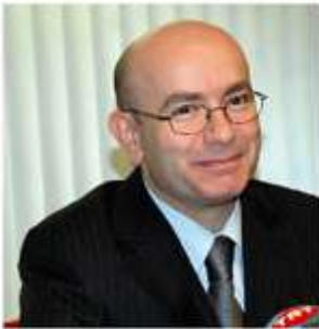
4 Başkonsolos Mustafa Pulat

Diese kostenlose Zeitschrift erscheint alle drei Monate in Türkisch und Deutsch, mit einer Auflage von 5.000 Exemplaren. Artikel, die mit den Namen gekennzeichnet sind, entsprechen nicht immer der Meinung der Redaktion, sondern des Autors. Keine Gewähr für unverlangt eingesandte Fotos und Manuskripte. Druckfehler vorbehalten. Alle Rechte vorbehalten. Ohne ausdrückliche Genehmigung, ist es nicht gestattet, Werbeanzeigen und Texte zu kopieren oder zu vervielfältigen.