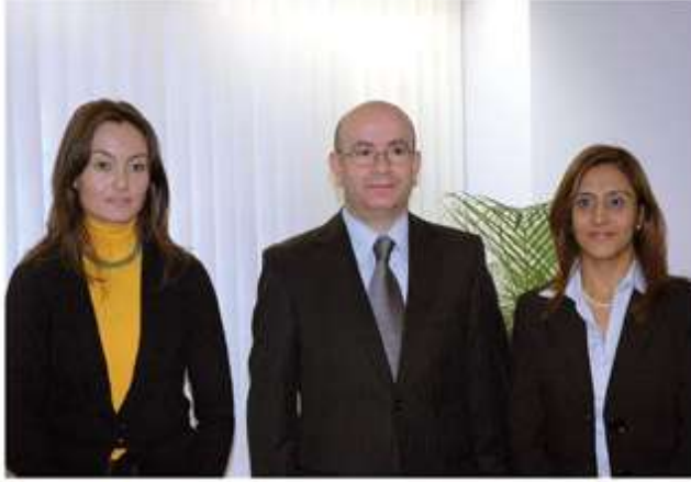
BERLİN YENİ BAŞKONSOLOSU MUSTAFA PULAT

Önceliğimiz Eğitim, Kültür ve Vatandaşlarımızın Ekonomik durumu olacaktır."