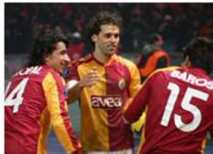
40 Hertha BSC - Galatasaray