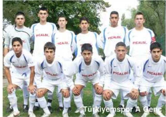
Türkiyemspor A Genç

Regionalliga A Gençler liginde başarıdan başarıya koşan göz bebeğimiz Türkiyemspor A Genç takımı bu yıl da göz kamaştırıyor. Bulduğu grupta çok kuvvetli ekiplerle mücadele etmesine rağmen, iceride ve dışarıda aldığı galibiyetlerle lig sıralamasında 4. durumda bulumaktalar. A genç takımları arasında yapılan Almanya Kupası'nı da da çeyrek finale yükselmeleri de başarılı geçirdikleri sezonun göstergesi. Sezonun ilk yarısında oynadıkları 13 maçta 8 galibiyet, 2 beraberlik ve 3 mağlubiyet alan mavi-beyazlı gençler, attıkları 36 gole karşılık kalelerinde sadece 17 gol gördüler. Sezonun ilk yarısını topladıkları 26 puanla 4. Sırada bitiren Türkiyemspor A Gençlerinin ikinci yarıda alacağı başarılı sonuçlar da Berlinli sporseverler tarafından merakla bekleniyor.