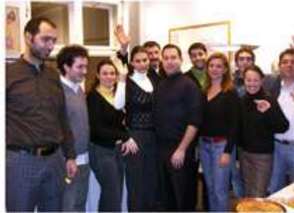
15 Radyo Multikulti