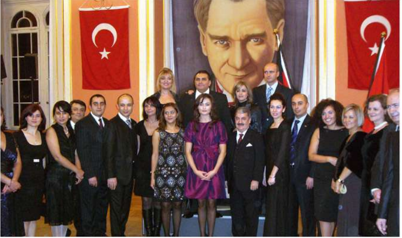
CUMHURİYET BAYRAMI KUTLAMASI TÜRKİYE'NİN BERLİN BÜYÜKELÇİSİ ACET, CUMHURİYETİN 85. YIL DÖNÜMÜ NEDENİYLE RESEPSİYON VERDİ

Mutluyuz, çünkü bu Türkiye'ye gösterilen bir itibarı da yansıtıyor. Hepinize teşekkür ediyor ve Cumhuriyet Bayramınızı kutluyorum" dedi.