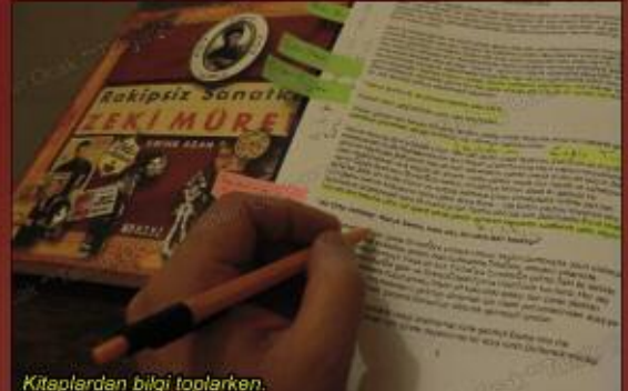
Kitaplardan bilgi toplarken.