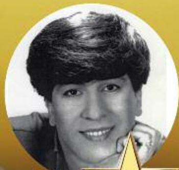
mit Live Orchester Hatay Engin