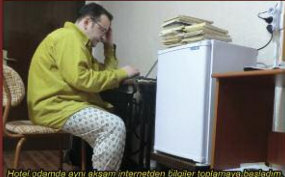
Hotel odamda aynı akşam internetten bilgiler toplamaya başladım.