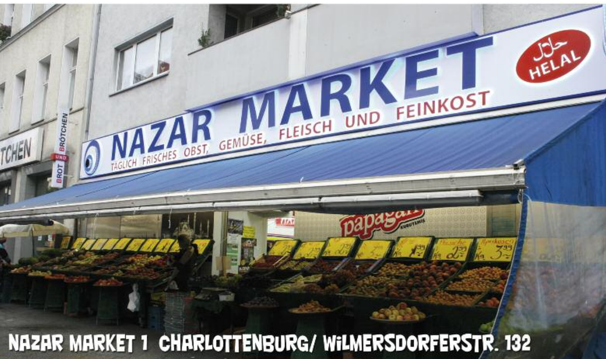
NAZAR MARKET 1 CHARLOTTENBURG/ WILMERSDORFERSTR. 132