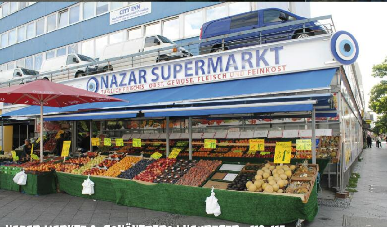
NAZAR MARKET 2 SCHÖNEBERG/ HAUPTSTR. 113-115