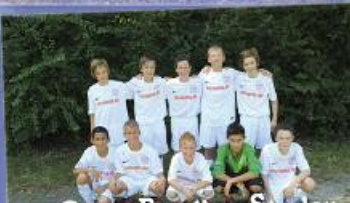
2. Platz Berolina Stralau