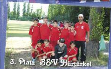
3. Platz BSV Hürtürkel