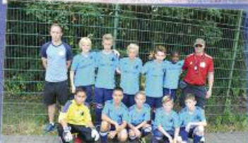
1. Platz SV Empor Berlin