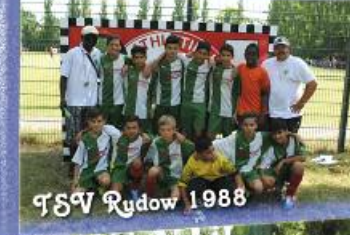
TSV Rydow 1988